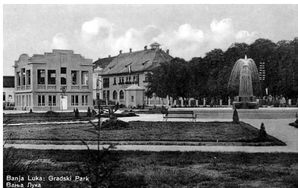
Stari izgled gradskog parka u Banja Luci

tog prostora prikazuju simetrično rješenje u stilu francuskih parkova omeđenog lijepo oblikovanom ogradom od kamena i laganih metalnih rešetki s centralno postavljenom fontanom. U isto vrijeme, u Parku je podignuta zgrada muzičkog paviljona. Fotografije tog objekta, koji je porušen nakon Drugog svjetskog rata, pokazuju da su na njemu bili primijenjeni neoklasicistički elementi po uzoru na mnoge tada popularne muzičke paviljone u Evropi. Većina autora koji su proučavali banjalučku arhitekturu u periodu Vrbaske banovine, a samim tim i arhitekturu muzičkog paviljona, stilski ga povezuju s arhitekturom Bauhauasa, iako on, sudeći prema malobrojnim sačuvanim fotografijama, sadrži neke elemente koji su anahroni i izdvajaju ga iz ovako jasne stilske definisanosti. 2 Nakon uspješno sprovedenog javnog jugoslovenskog konkursa 1932. godine, u Parku je postavljen spomenik Petru Kočiću, rad vajara Antuna Augustinčića i Vanje Radauša. Kočić je prikazan kao protagonist slobode, namrgođenog čela i ispružene desne ruke – aluzija na vrijeme kada je kao narodni tribun „grmio“ s govornice boreći se za slobodu čovjeka, njegovu političku i ekonomsku ravnopravnost. Preko šest metara visok, spomenik je bio dominantan orijentir u novonastaloj parkovskoj cjelini, u kojoj su hortikulturni elementi, s njegovanim niskim rastinjem i širim pojasevima travnatih površina, dodatno naglašavali takav utisak. 3